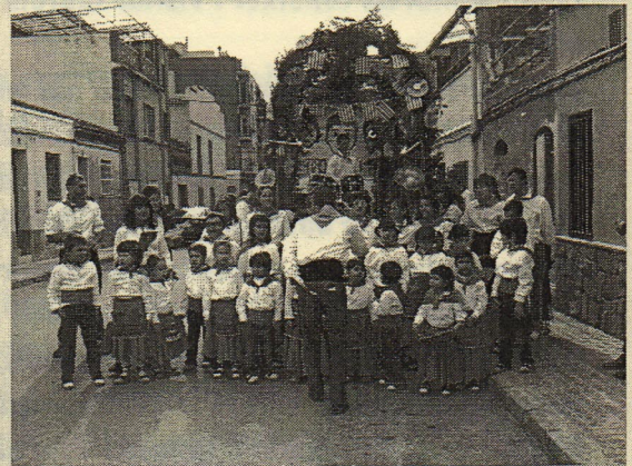
Caramelles a Sant Vicenç de Castellet