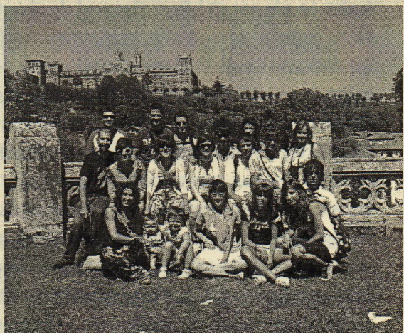
Viatge a Cantàbria

edita: associació musical castellet c. de la sardana s/n (tèxtil montserrat) 08295 sant vicenç de castellet info@amcastellet.com